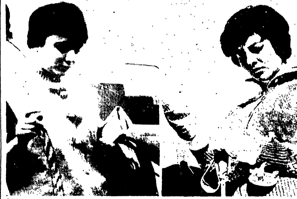
TEHERAN. — Lo Sfr di Persia ha annunciato ufficialmente il suo imminente matrimonio con la giovane Farah Diba (a sinistra). Nello stesso tempo ha inviato una lettera alla ex moglie Soraya (a destra) per assicurarle il suo perenne affettuoso ricordo e uno stipendio di mille dollari, pari a circa 650.000 lire, settimanali

Gli altri risultati ADRIA — L'elettorato ha restituito una netta flessione rispetto alle precedenti consultazioni, per le emigranti in massa dei lavoratori, che colpiscono in grande misura i partiti dei lavoratori. Ecco i risultati (tra parentesi quelli delle precedenti amministrative e del 1958): PCI: 3.582 (4.057, 3.973), 22,4% (23,6, 22,9); seggi 9 (10); PSI: 3.723 (4.029, 3.508), 23,2% (23,3, 24,0); seggi 10 (9); DC: 4.525 (7.023, 6.914), 40,8% (40,8, 39,9); seggi 17 (17); PSDI: 644 (870, 785), 4,7% (5,1, 4,5); seggi 1 (2); PRI: 466 (604, 558), 2,9% (3,5, 2,1); seggi 1 (1); MSI: 401 (424), 2,5% (2,5).